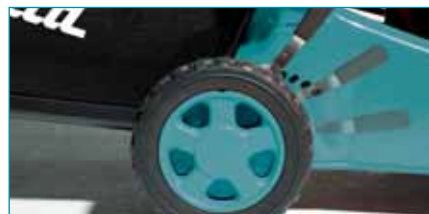
Központi magasság-beállítás a Style-szériánál

3. Vágómagasság-beállítás: Igen könnyű beállítani, hogy milyen magasan szeretnénk lenyírni a fűvet. A fogantyú segítségével közepén egyszerűen emelje meg, majd eressze le a vágóházat. Az Advance modelleknél ugyanez a beállítás a keréknél történik.