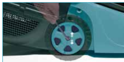
Advance modell magasság-beállítása a keréknél

3. Vágómagasság-beállítás: Igen könnyű beállítani, hogy milyen magasan szeretnénk lenyírni a fűvet. A fogantyú segítségével közepén egyszerűen emelje meg, majd eressze le a vágóházat. Az Advance modelleknél ugyanez a beállítás a keréknél történik.