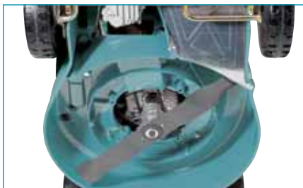
Nagyobb füves területhez nagyobb vágószélesség

1. Szélesség: Minél nagyobb az ápolandó füves terület, annál célszerűbb nagy vágószélességű fűnyírót választani. A Makita kínálatában a szélesség tekintetében a 35 cm-től (kb. 400 m 2 -es területhez) az 53 cm-ig (kb. 2400 m 2 -es területhez) terjed. Mondanunk sem kell, hogy a