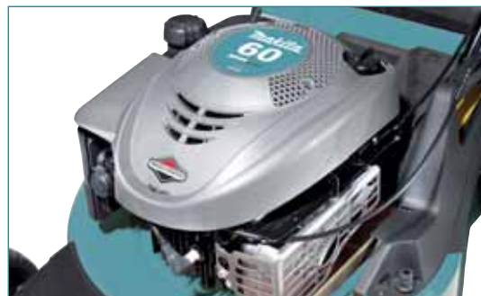
Könnyen beindítható, erőteljes és tartós - ezek az új, Briggs & Stratton gyártmányú, ReadyStart funkciós motor jellemzői

PLM4810 PLM4811 PLM4812 PLM4813 PLM5110 PLM5112