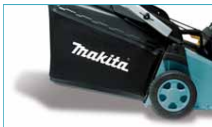
A levágott fű könnyen kezelhető