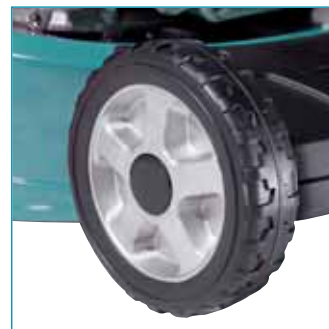
Stabil alumínium kerekek