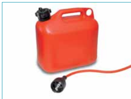
Kétféle hajtás közül választhatunk

A Makita elsődleges törekvése a kiváló minőség. Ezért motorokat csak világhírű cégektől - például a Briggs & Stratton-tól és a Honda-tól - szerez be, amelyek évtizedek óta élenjárnak a motorok fejlesztésében.