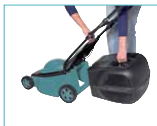
Könnyen kezelhető fűgyűjtő kosár

A vágómagasságot ezeken a modelleken is a keréknél lehet beállítani.