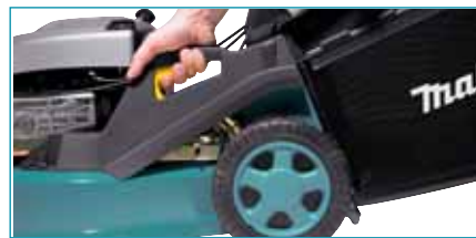
Alumínium házas fűnyíró központi magasság-beállítása