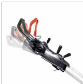
Az ErgoMow® markolat - az optimális munkavégzési testtartás érdekében rugalmasan állítható