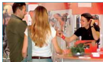
Szakszerű tanácsadás a kiváló minőségű kerti berendezésekről

Ne a felhasználónak kelljen alkalmazkodnia a fűnyírókhoz, hanem éppen ellenkezőleg. A Makita ezért fejlesztette ki a különféle beállítási lehetőségeket, amelyek révén a fűnyíró - a felhasználó magasságához igazodva - bárki által kiválóan és pontosan kezelhető. Különleges jellemző az Exclusive széria ErgoMow® markolata, amely 9 különféle helyzetbe állítható.