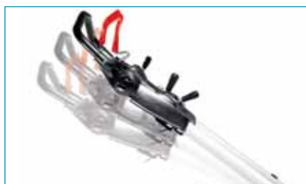
Állítható magasságú fogantyú bármilyen magasságú felhasználónak

Minél nagyobb a fűgyűjtő kosár befogadóképessége, annál ritkábban kell kiüríteni. Ennek előnye különösen a nagy gyepes területek nyírásakor érzékelhető. A kosár űmértete 27 litertől 75 literig terjed. Mindegyik modellre igaz, hogy a fűgyűjtő kosár könnyen eltávolítható, kiüríthető és visszatartítható a tartóhoronyba.