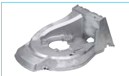
Rozsdamentes, könnyű és ellenálló

a) Alumínium: Ez a könnyűsúlyú anyag nemcsak korrózióálló, de rendkívül erős is. Nem meglepő hát, hogy az alumínium az autó- és