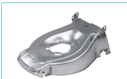
Az acél ideális anyag a rendkívül strapabíró fűnyírókhoz

repülőgépgyártásban, valamint az űrtechnikában is kedvelt anyagnak számít. Az Exclusive-szériába tartozó Makita fűnyírók tervezőmérnökeinek azért is esett a választásuk az alumíniumra, mert az tartós és szilárd.