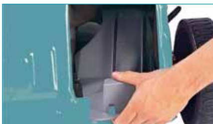
A Makita Style-lal nincsen gond - talajtakarás az elektromos modellel

felhasználót a nagy erő kifejtés terhe alól, a hátsó meghajtás pedig tovább fokozza a kényelmet.