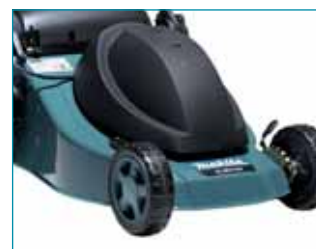
Csendes üzemű villanymotor