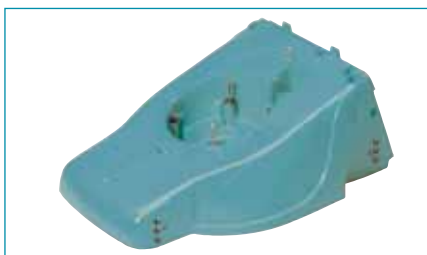
Rendkívül könnyű és rugalmas - ez a polipropilén

c) Polipropilén: A polipropilén az egyik legkönnyebb műanyag, mely ideális alapanyagul szolgál az elektromos fűnyírók vágóházának gyártásához. A gép súlyát a lehető legalacsonyabb szinten tartja, ugyanakkor elképesztően rugalmas.