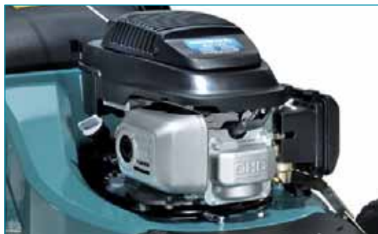
Meghajtás Honda motorral

A konstrukció kifejezett célja, a munkaterhelés csökkentése: a PLM4814 hajtószerelvénye - a rezgéscsillapító AVS rendszer - az innovatív mérnöki munka terméke. A rendszer lényege, hogy a fém tartókeretre szerelt motort gumi betétek választják el a vágóháztól, miáltal a felhasználó kezéhez és karjához elvezetett rezgés mértéke jóval kisebb lesz. A fűnyíró tartós működtetése esetén ez a megoldás sok fáradságtól kíméli meg a felhasználót, és energiamegtakarítással jár együtt.